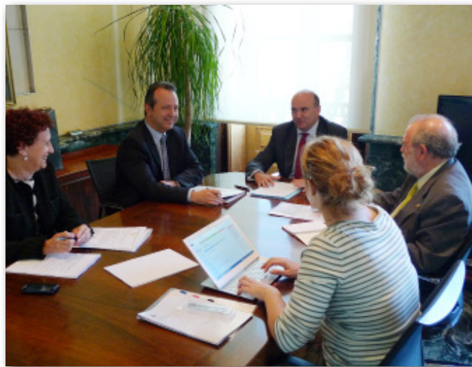
Momento de la reunión mantenida en Pamplona