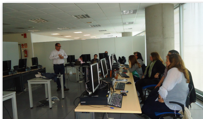
Dos momentos de la formación de Cuerpos Generales de la Administración de Justicia de Melilla