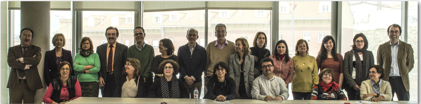
Los participantes y el secretario coordinador provincial durante las jornadas de estancias tutorizadas en la Oficina Judicial de Cuenca

Como ya es tradición desde la puesta en marcha de las primeras Oficinas Judiciales del Ministerio de Justicia, los pasados días 26, 27 y 28 de marzo se celebró en la Oficina Judicial de Cuenca una nueva edición del Programa de Estancias para secretarios judiciales. Se trata de un programa eminentemente práctico que permite conocer en directo la nueva organización, su funcionamiento y la experiencia por parte de quienes desempeñan en ella su actividad diaria. A continuación, se expone un resumen de la valoración de los asistentes a esta edición.