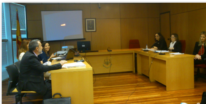
Momento de la celebración del GTI

Durante los días 8 y 9 de abril se celebró una nueva reunión del Grupo Técnico de Implantación de la Oficina Judicial de Melilla con el objeto de realizar el seguimiento de los trabajos para el despliegue técnico del nuevo modelo de la Administración de Justicia.