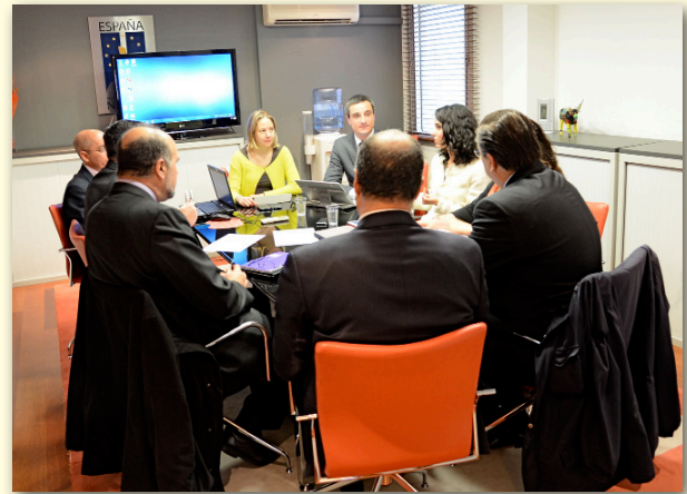
Momento de la reunión con el Consejo General del Notariado

jo interinstitucional se analizó la viabilidad de dar acceso a los juzgados y tribunales a los poderes notariales otorgados a procuradores.