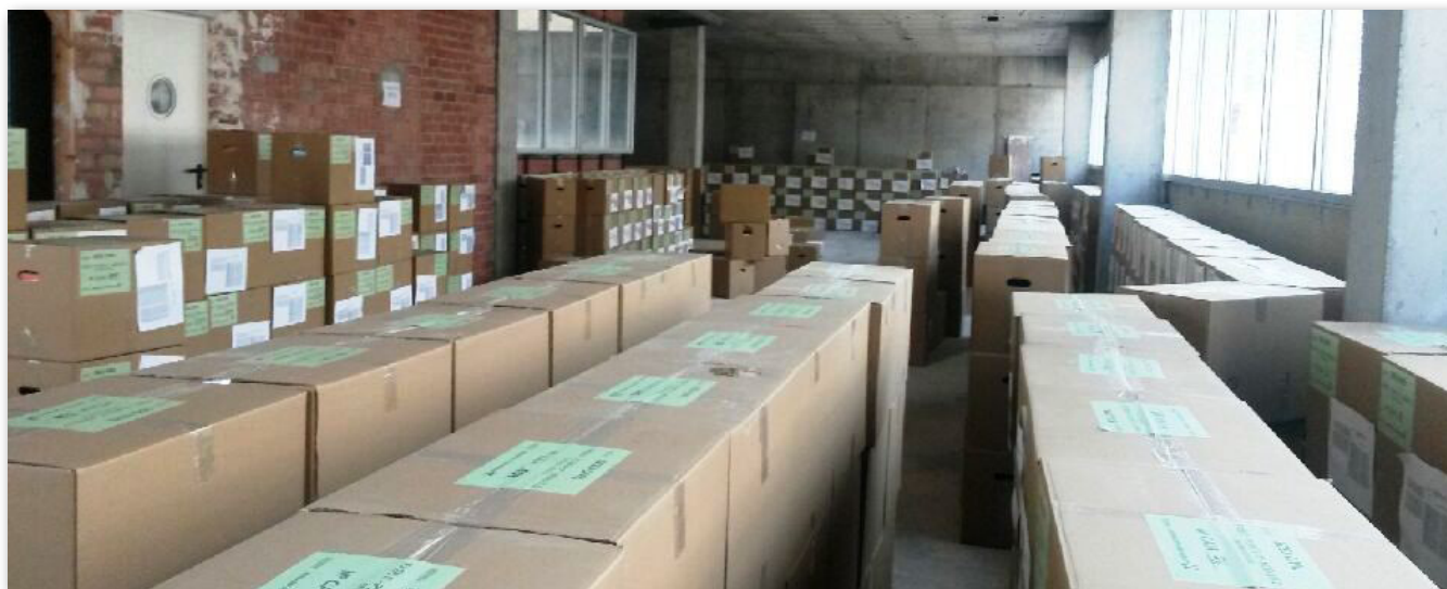
Cajas de expedientes judiciales listas para su mudanza

fesionales se verá afectado desde las 15 h. del viernes 20 hasta las 8 h. del día 25 de marzo . El servicio no se verá afectado en aquellos órganos judiciales no incluidos en la oficina judicial ni en los que no cambian de ubicación física.