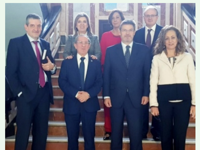
Visita del ministro a la Fiscalía de Valladolid

tado y el Ministerio de Justicia con el fin de fortalecer la colaboración entre ambas instituciones de cara a una implantación eficaz y efectiva de la Fiscalía digital.